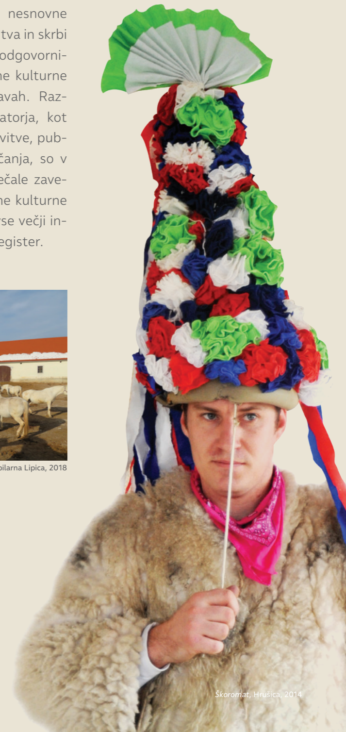
Škoromat, Hrušica, 2014