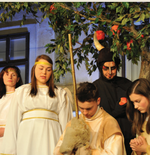
Škofjeloški pasijon (2016)