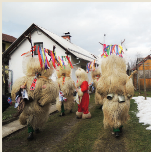
Obhodi kurentov (2017)