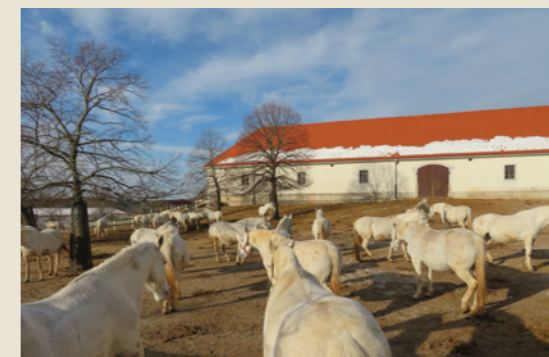
Lipicanci, Kobilarna Lipica, 2018

Reprezentativni seznam nesnovne kulturne dediščine človeštva in skrbi za stike z ustanovami, odgovornimi za varovanje nesnovne kulturne dediščine v drugih državah. Različne aktivnosti Koordinatorja, kot so razstave, javne predavitve, publikacije in strokovna srečanja, so v Sloveniji nedvomno povečale zavedanje o pomenu nesnovne kulturne dediščine in vplivale na vse večji interes nosilcev za vpis v Register.