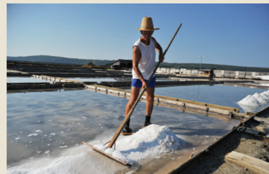
Pobiranje soli, Sečoveljske soline, 2018

Reprezentativni seznam nesnovne kulturne dediščine človeštva in skrbi za stike z ustanovami, odgovornimi za varovanje nesnovne kulturne dediščine v drugih državah. Različne aktivnosti Koordinatorja, kot so razstave, javne predavitve, publikacije in strokovna srečanja, so v Sloveniji nedvomno povečale zavedanje o pomenu nesnovne kulturne dediščine in vplivale na vse večji interes nosilcev za vpis v Register.