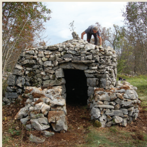
Umetnost suhozidne gradnje, znanje in tehnike (2018)