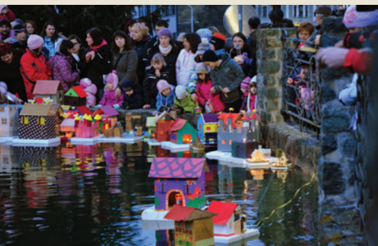
Spuščanje gregorčkov, Kropa, 2013

Slovenija je Unescovo Konvencijo o varovanju nesnovne kulturne dediščine ratificirala leta 2008, nesnovno kulturno dediščino pa je vključila tudi v novi Zakon o varstvu kulturne dediščine (2008), ki je prej omenjal le premično in nepremično materialno dediščino. Register nesnovne kulturne dediščine, ki ga vodi Ministrstvo za kulturo RS, je začel nastajati leta 2008. Konec leta 2018 je bilo v Register vpisanih 67 enot, od katerih so bile štiri vpisane na Unescov Reprezentativni seznam nesnovne kulturne dediščine človeštva. Naloge Koordinatorja varstva nesnovne kulturne dediščine opravlja Slovenski etnografski muzej, osrednja ustanova za varovanje nesnovne kulturne dediščine v Sloveniji.