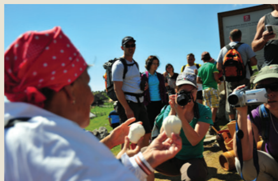
Dokumentiranje nesnovne kulturne dediščine na Veliki planini, 2013

Slovenski etnografski muzej je bil ustanovljen leta 1923. Kot nacionalna ustanova skrbi za dokumentiranje, zbiranje, preučevanje, hranjenje, varovanje in predstavljanje materialne in nesnovne kulturne dediščine