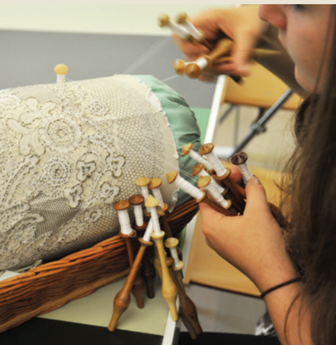
Klekljanje čipk v Sloveniji (2018)