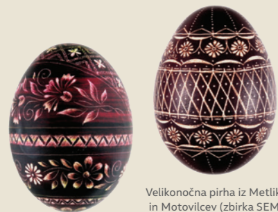
Velikonočna pirha iz Metlike in Motovilcev (zbirka SEM)