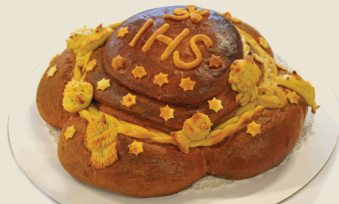
Poprtnik, Velike Lašče, 2014

Slovenija je Unescovo Konvencijo o varovanju nesnovne kulturne dediščine ratificirala leta 2008, nesnovno kulturno dediščino pa je vključila tudi v novi Zakon o varstvu kulturne dediščine (2008), ki je prej omenjal le premično in nepremično materialno dediščino. Register nesnovne kulturne dediščine, ki ga vodi Ministrstvo za kulturo RS, je začel nastajati leta 2008. Konec leta 2018 je bilo v Register vpisanih 67 enot, od katerih so bile štiri vpisane na Unescov Reprezentativni seznam nesnovne kulturne dediščine človeštva. Naloge Koordinatorja varstva nesnovne kulturne dediščine opravlja Slovenski etnografski muzej, osrednja ustanova za varovanje nesnovne kulturne dediščine v Sloveniji.