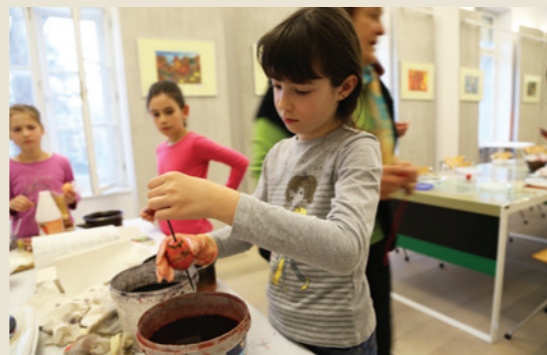
Delavnica izdelovanja velikonočnih pirhov, SEM, 2015

Koordinator sodeluje pri pripravi nominacij za vpis na Unescov