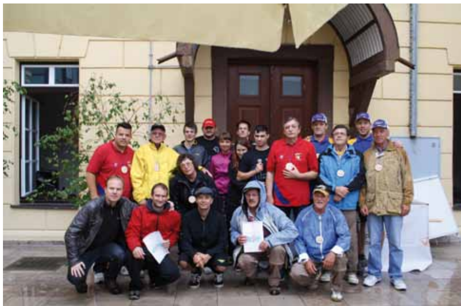
Skupinska fotografija po razglasitvi rezultatov in podelitvi priznanj