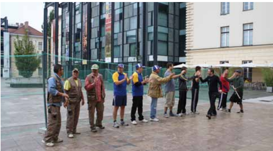
Predstavitve tekmovalnih ekip na turnirju Slovenskega etnografskega muzeja

Na ploščadi pred Slovenskim etnografskim muzejem smo v sodelovanju z nosilci nesnovne kulturne dediščine v avgustu 2014 priredili prijateljski turnir v pandolu , tradicionalni istrski igri, v kateri dve ekipi tekmujeta v osvajanju ozemlja. Marca 2013 je bila igra vpisana v Register žive kulturne dediščine, tri društva s Primorske pa evidentirana kot nosilci, ki dediščino svojih prednikov ohranjajo tudi na tovrstnih prireditvah. Po izvoru pandolo velja za pastirsko igro, predhodnico bejzbola in kriketa, ki so jo pri nas otroci in mladina do šestdesetih let 20. stoletja igrali na dvoriščih, ulicah in trgih istrskih vasi in mest. Ime je igra dobila po ošiljeni leseni paličici pandolo , ki jo igralci odbijajo z leseno palico maco in tako osvajajo igrišče. Od leta 1993, ko so igranje pandola oživili s prvim uradnim turnirjem v Kopru, pa do danes si igralci aktivno prizadevajo za ohranjanje igre kot dela kulturne dediščine slovenske Istre. Ob oživitvi je pandolo postal športna igra z zapisanimi pravili, ki jo ekipe igrajo na urejenih igriščih. Igranje pandola se je iz obalnih mest razširilo tudi v Prekmurje.