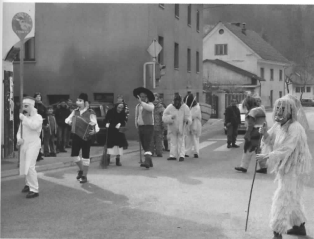
Laufarji. Cerklje ob Krki, 25. 1. 2009